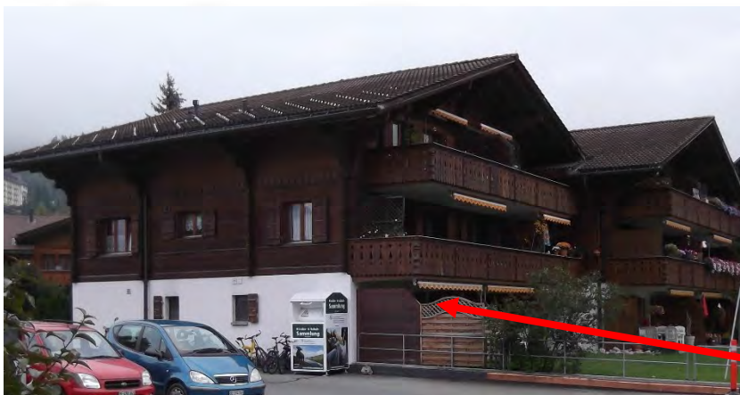
Studio Nr. 3